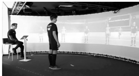
Рис. 1.1. «Footbonaut machine» Рис. 1.2. Бенфіка Лаб «360» Рис.1.3. Кімната віртуальної реальності