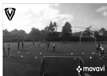
Рис. 1.5. Рухове завдання «2x2»

Висновки. Високий рівень тактичної підготовки є одним із найважливіших чинників переваги над суперником у грі. Отже, для оптимізації процесу тактичної підготовки юних футболістів в Україні необхідно вводити в навчально-тренувальний процес сучасні інтерактивні засоби, які сприятимуть тактичному вдосконаленню.