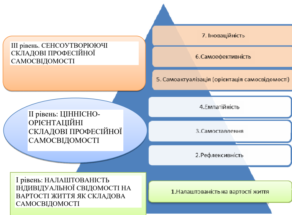
Рис. 1. Теоретична модель рівнів та компонентів самосвідомості майбутніх спеціальних педагогів

Запропонована теоретична ієрархічна модель професійної самосвідомості дозволяє розуміти професійну самосвідомість майбутнього спеціального педагога як ієрархічне утворення: конструктивних (емпатійна, альтруїстична, антиципаційна, «норма взаємності») й неконструктивних (маніпулятивістська, нарцисична, утилітаристська, релятивістська) налаштованостей, а також особливостей ціннісної зорієнтованості (рефлексивність, самоставлення, емпатійність) та сенсоутворення (персональні орієнтації: самоактуалізація, самоефективність та інноваційність).