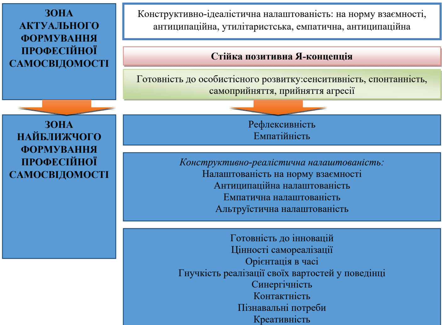
Рис. 2. Емпірична модель формування професійної самосвідомості майбутніх спеціальних педагогів

Згідно з результатами дослідження пропонується емпірична модель посилення окремих чинників з формування професійної самосвідомості студентів-майбутніх спеціальних педагогів (рис. 2).