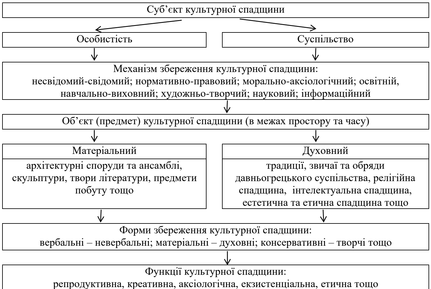
Рис. 3. Модель культурно-освітньої спадщини давньогрецьких Олімпійських ігор

У шостому розділі «Соціально-культурна спрямованість олімпійського руху як засіб гуманітарного розвитку суспільства» обґрунтовано модель культурно-освітньої спадщини давньогрецьких Олімпійських ігор, що складається з системи елементів та рівнів їх соціокультурних взаємодій (рис. 3).