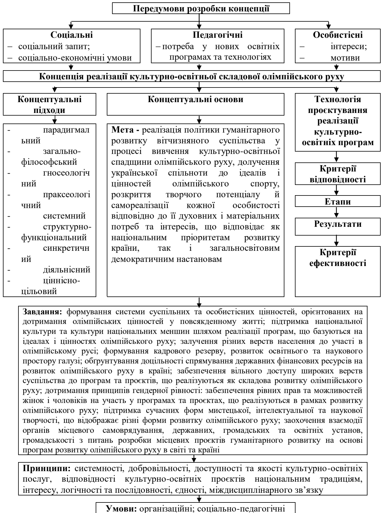
Рис. 4. Концепція реалізації культурно-освітньої складової міжнародного олімпійського руху як елементу гуманітарного розвитку суспільства