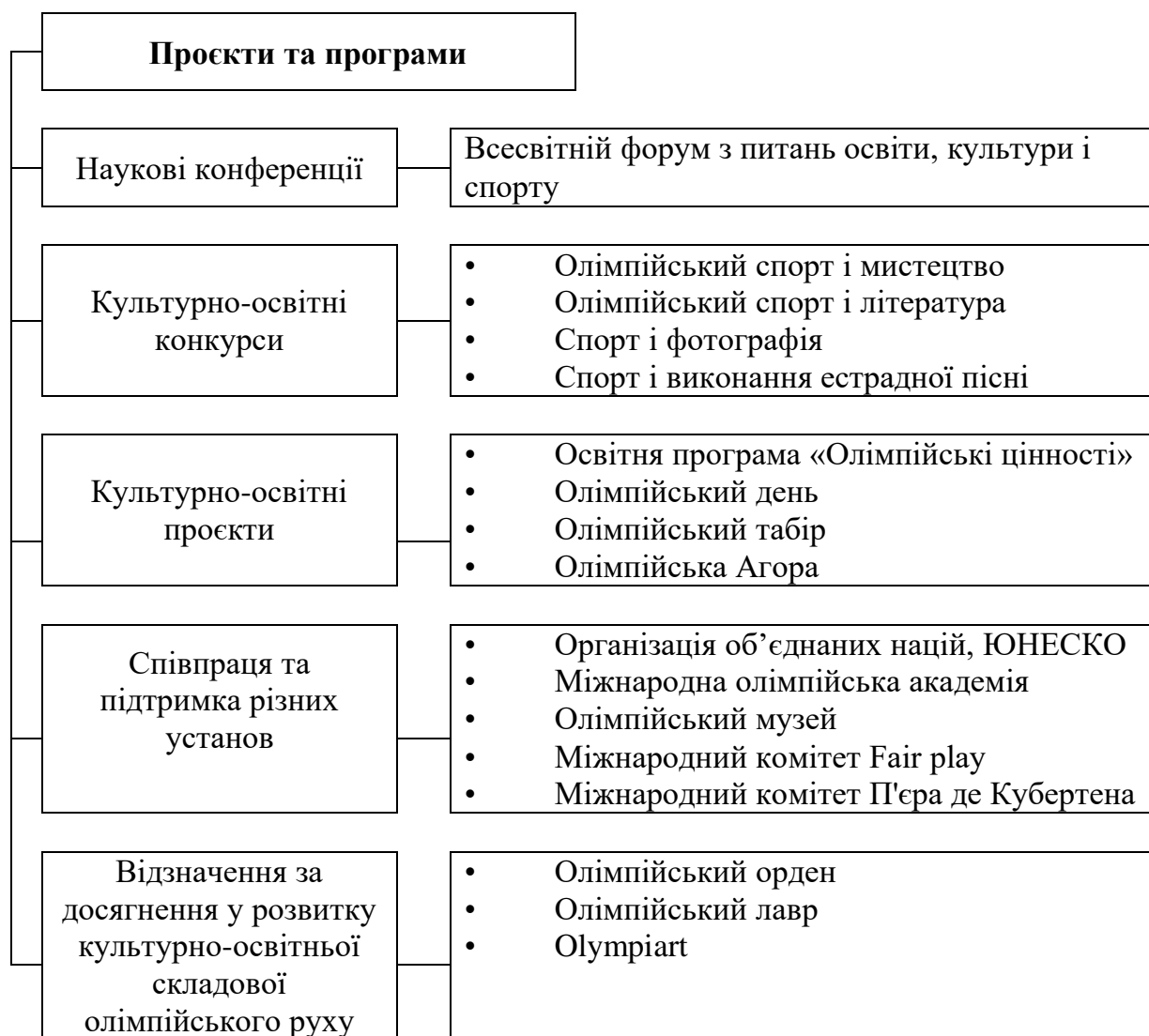
Рис. 1. Культурно-освітні проекти та програми, що реалізуються Міжнародним олімпійським комітетом

Проведення наукових форумів, конкурсів митців, відзначення лауреатів за розбудову культурно-освітньої компоненти сучасного олімпійського руху сприяє не лише його міжнародному розвитку, а й залученню до ціннісного гуманітарного потенціалу олімпійського спорту різних соціально-демографічних верств населення.