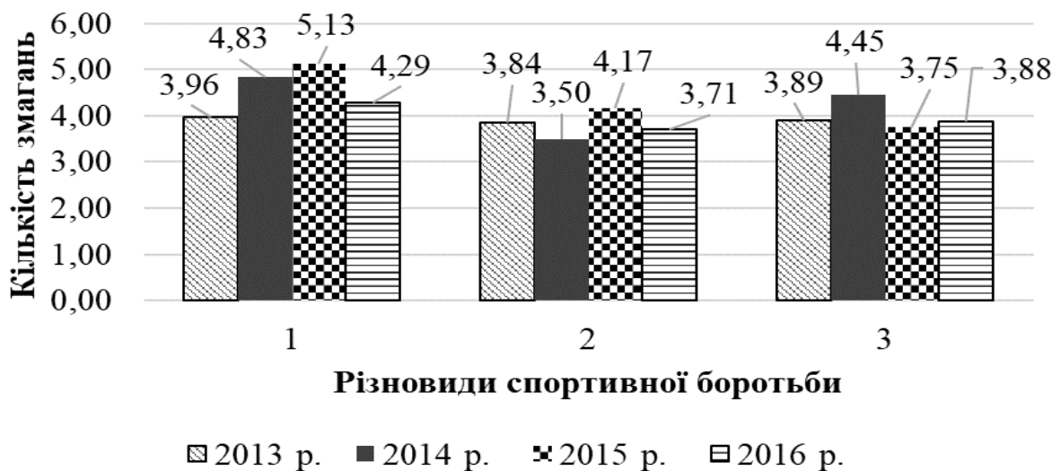
Рис. 2. Середні арифметичні обсяги змагальної практики представників різновидів спортивної боротьби у 2013–2016 рр. (n=72):

У спортивній боротьбі в олімпійському циклі 2013–2016 рр. виявлено схожі різновиди тактики: утримування лідерства (n=22); поступового підвищення результатів (n=33); комбіновану (n=12); повернення лідерства (n=5). За більшістю показників (результатами на головних змаганнях, середнім арифметичним місцем, найвищими та найнижчими результатами, обсягами змагальної практики, показниками медальних здобутків) групи спортсменів, які застосовували різні види тактики участі в системі змагань олімпійських циклів, були достовірно відмінними ( p < 0,05 ) (рис. 2).