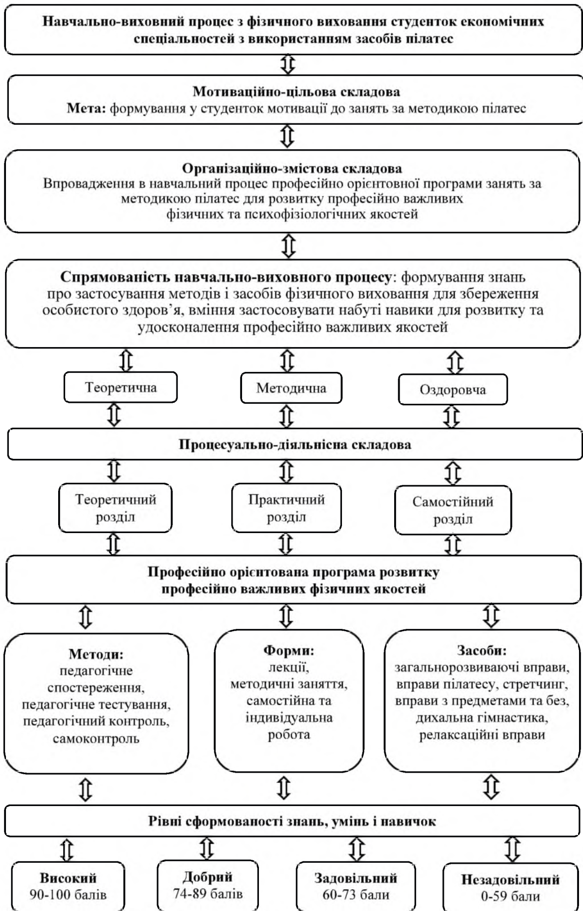
Рис. 2. Структура методики навчання розвитку професійно важливих якостей студенток – майбутніх фахівців економічних спеціальностей