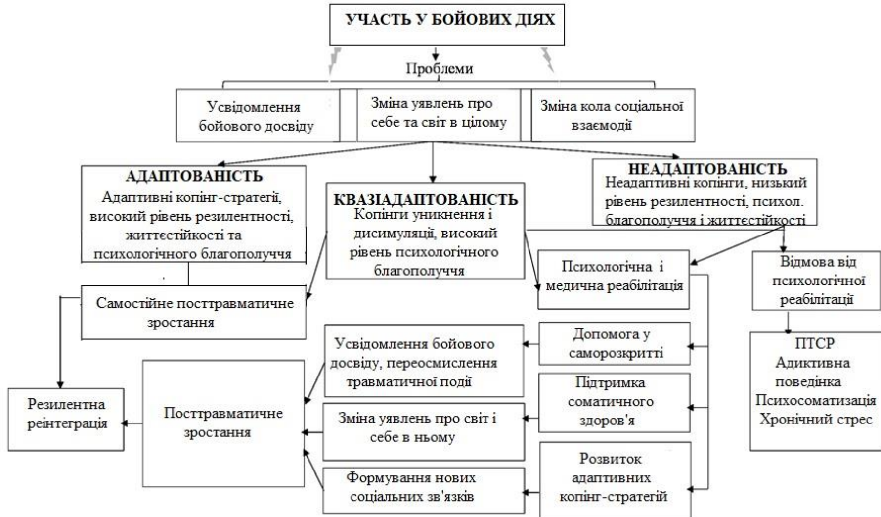
Рис. 2. Структурна модель адаптації учасників бойових дій