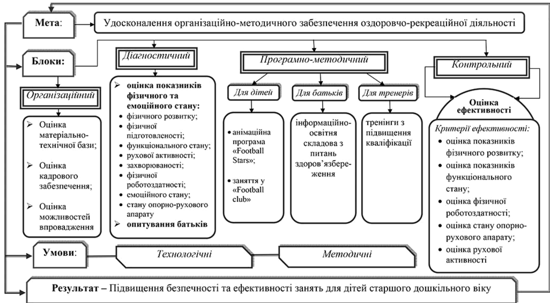
Рис. 1. Структура моделі організаційно-методичного забезпечення оздоровчо-рекреаційної діяльності дитячого футбольного клубу