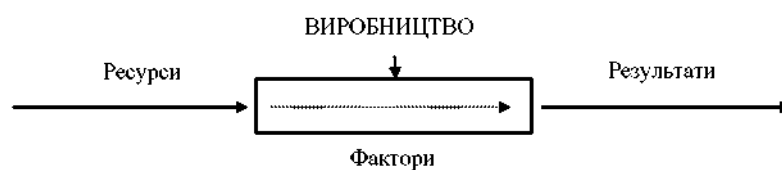
Рис. 3.3. Ресурси і фактори виробництва

Виробництво можна уподібнити «чорному ящику», який привертає увагу до трьох моментів - що на «вході»? що «всередині»? та що на «виході»? (рис. 3.3). Інакше кажучи, маємо з'ясувати поняття «ресурси виробництва», «фактори виробництва» і «результати виробництва».