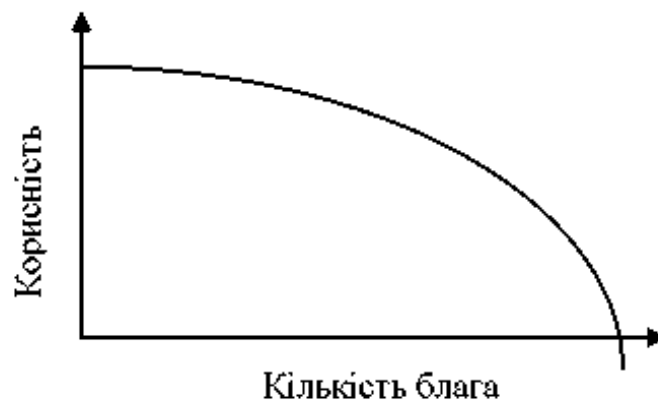
Рис. 3.2. Крива граничної корисності

У цьому явищі, що простежується повсякчас у поведінці кожного споживача, проявляється регулююча роль одного із трьох фундаментальних законів економіки - закону спадної граничної корисності . Згідно із цим законом, по мірі насичення потреби корисність кожної додаткової одиниці блага спадає, допоки не стане від'ємною (рис. 3.2).