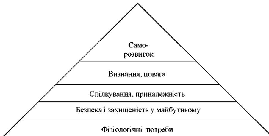
Рис. 3.1. Піраміда потреб Маслоу

піраміда, або ієрархія, потреб американського психолога Абрахам Маслоу (рис. 3.1).