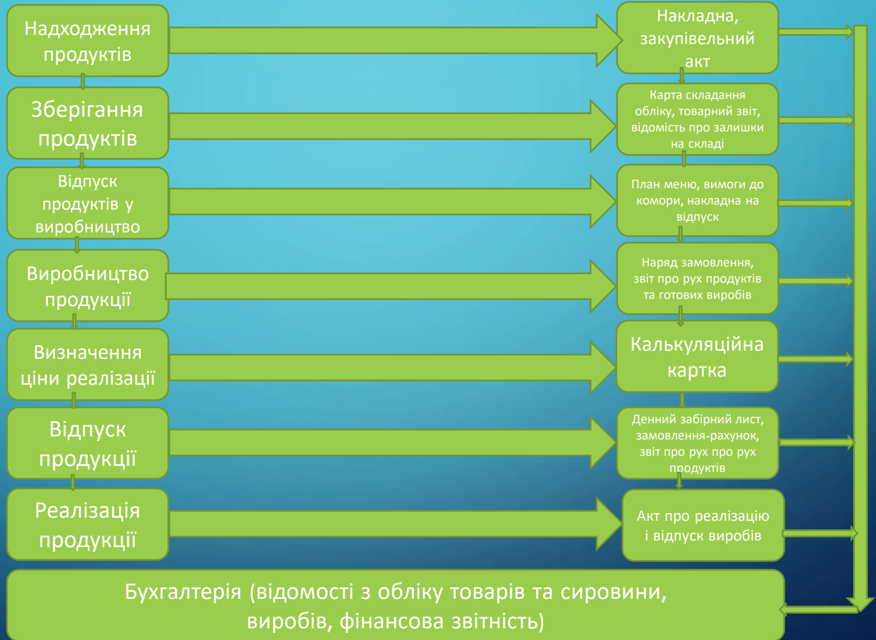
Схема супроводження стадій технологічного процесу документообігом закладу харчування