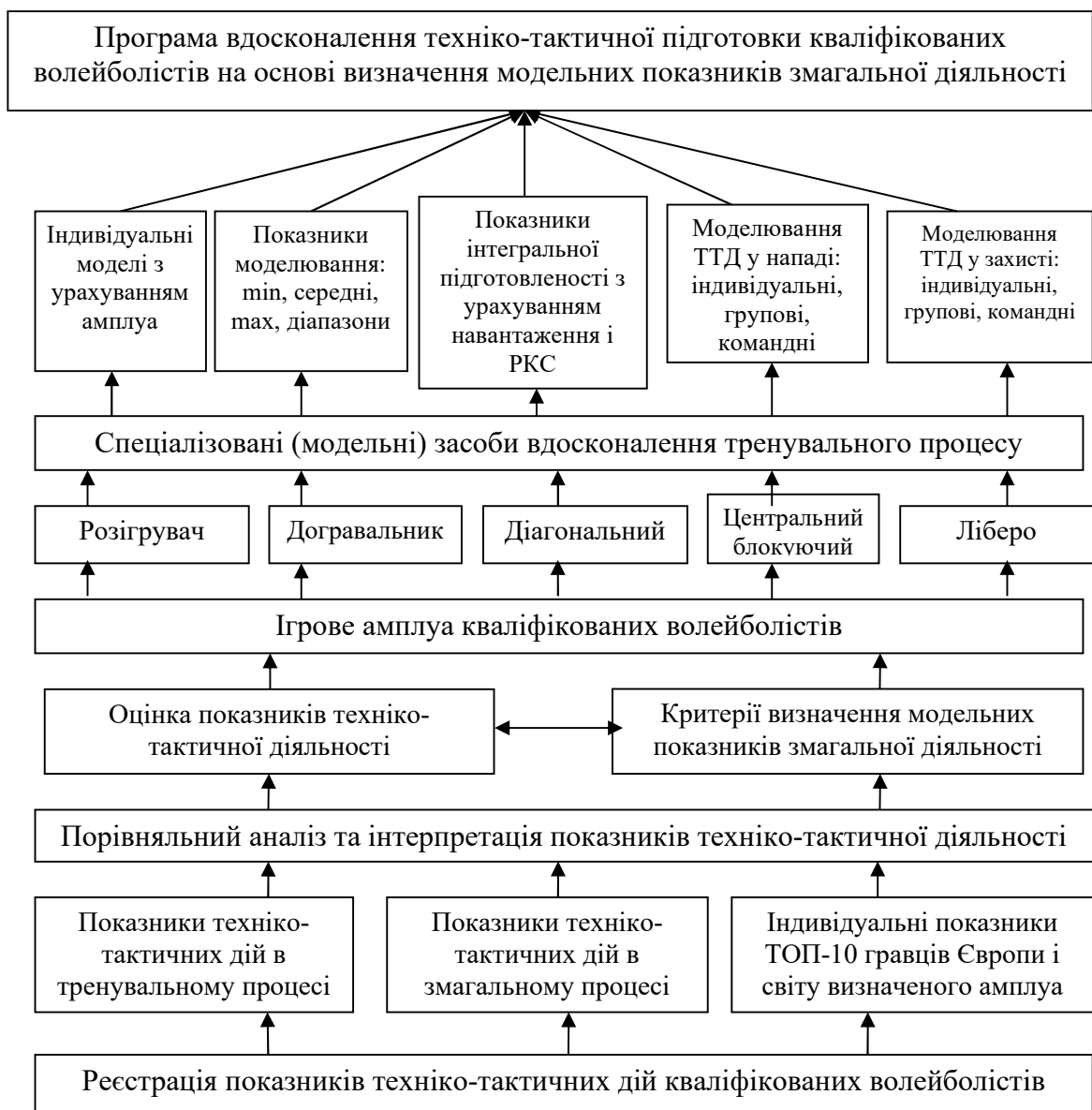
Рис. 2. Блок-схема алгоритму формування експериментальної програми вдосконалення техніко-тактичної підготовки кваліфікованих волейболістів з використанням модельних характеристик змагальної діяльності.

У загальному вигляді блок-схема алгоритму формування запропонованої нами експериментальної програми для підвищення рівня техніко-тактичної підготовленості кваліфікованих волейболістів різних ігрових амплуа та ефективності тренувального процесу наведена на рис. 2.