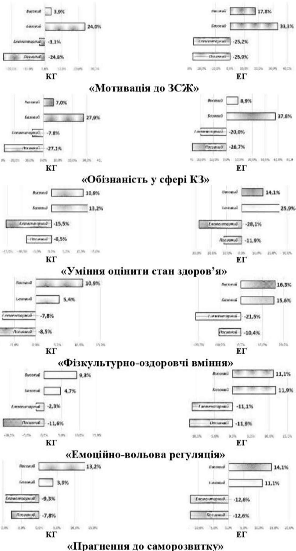
Рис. 2. Динаміка рівнів сформованості культури здоров'я за показниками