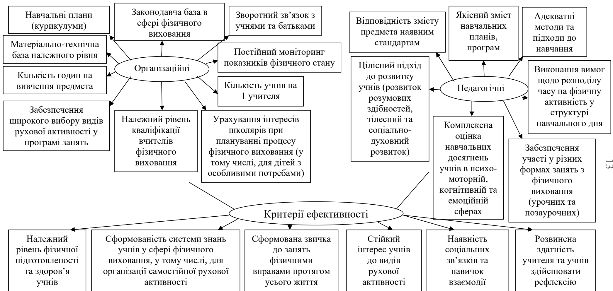
Рис. 1. Організаційні та педагогічні умови забезпечення якості фізичного виховання школярів