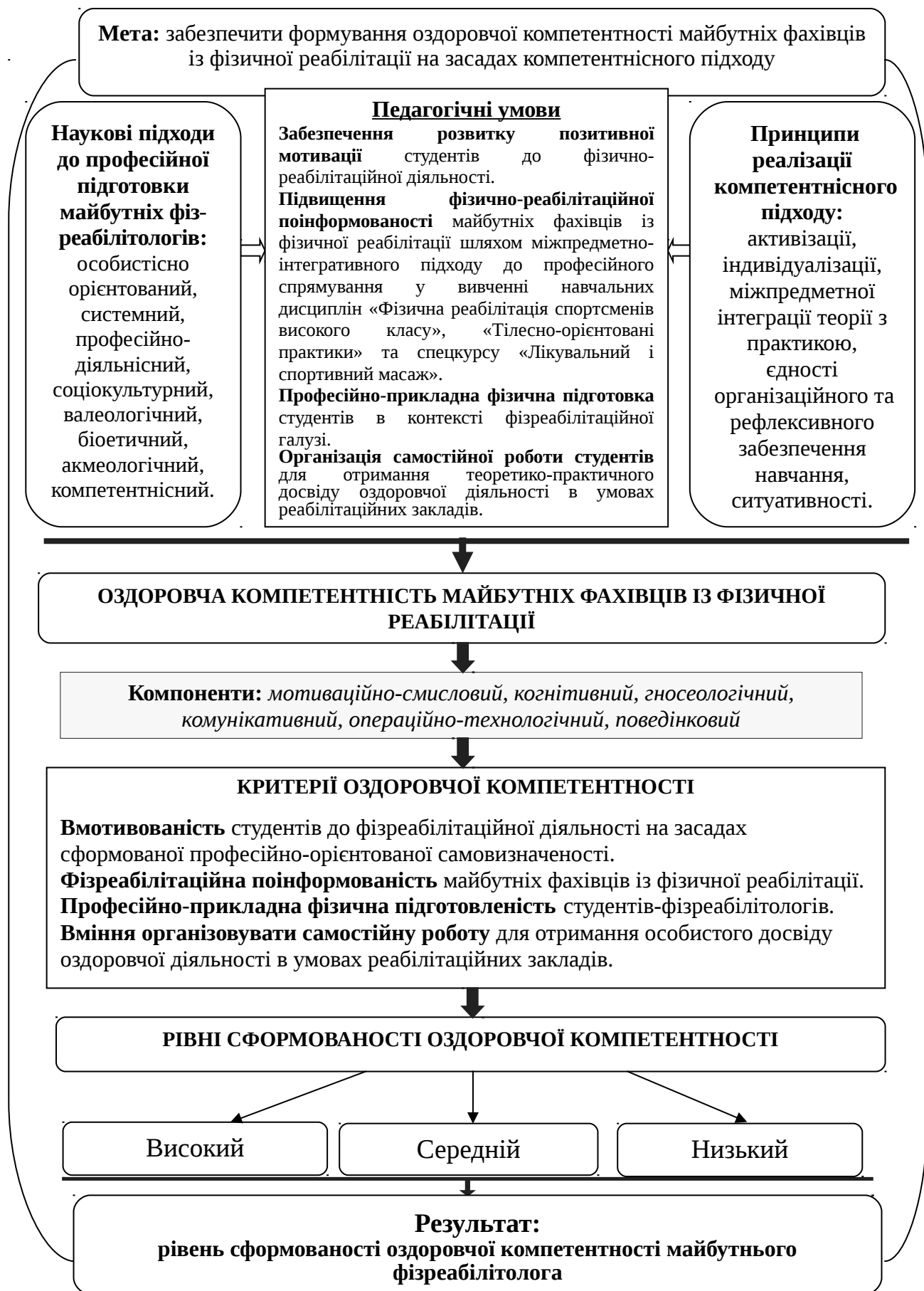
Рис. 1. Структурно-функціональна модель формування оздоровчої компетентності майбутніх фахівців із фізичної реабілітації на засадах компетентнісного підходу.