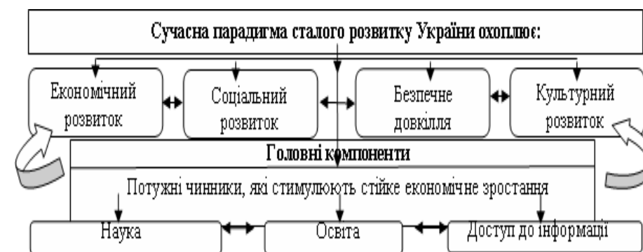
Рис. 3. Концепція сучасної парадигми сталого розвитку України, що ґрунтується на розвитку науки, освіти та доступі до інформації

Основні завдання соціального партнерства як необхідної передумови функціонування механізмів державного управління забезпеченням якості у сфері вищої освіти: спільне оцінювання суб'єктами кадрової ситуації в країні; визначення пріоритетів формування необхідного професійного, кадрового та інтелектуального потенціалу; координація ефективного використання трудових ресурсів, створення робочих місць; прогнозування та планування професійної підготовки; визначення стратегії формування і розвитку інституту державної служби. Таким чином, концепція сучасної парадигми сталого розвитку України, що ґрунтується на науці, освіті та доступі до інформації повинна включати принаймні чотири важливі сфери (рис. 3).