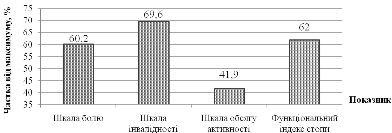
Рис. 1. Рівень отриманих балів за опитувальником Функціонального індексу стопи відносно максимально можливих

Функціональний індекс стопи мав достатньо високі результати. Так, середньостатистичні показники склали ( 105,35 \pm 28,95 ) бала з можливих 170 балів, при показниках Me (25; 75) - 99,5 (82; 136) бала. Оскільки шкали та функціональний індекс стопи мали різні максимально можливі рівні, були розраховані їх відносні показники. У такий спосіб, найкращу оцінку мала шкала обсягу активності (рис. 1).