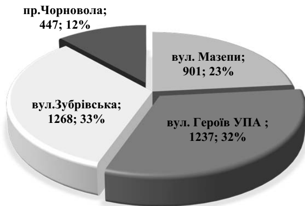
Рис. 1 Денна відвідуваність фітнес-клубів «Sport Life»

посідають друге і третє місця. У середньому за день усі фітнес-клуби «Sport Life» відвідують 3853 клієнти.