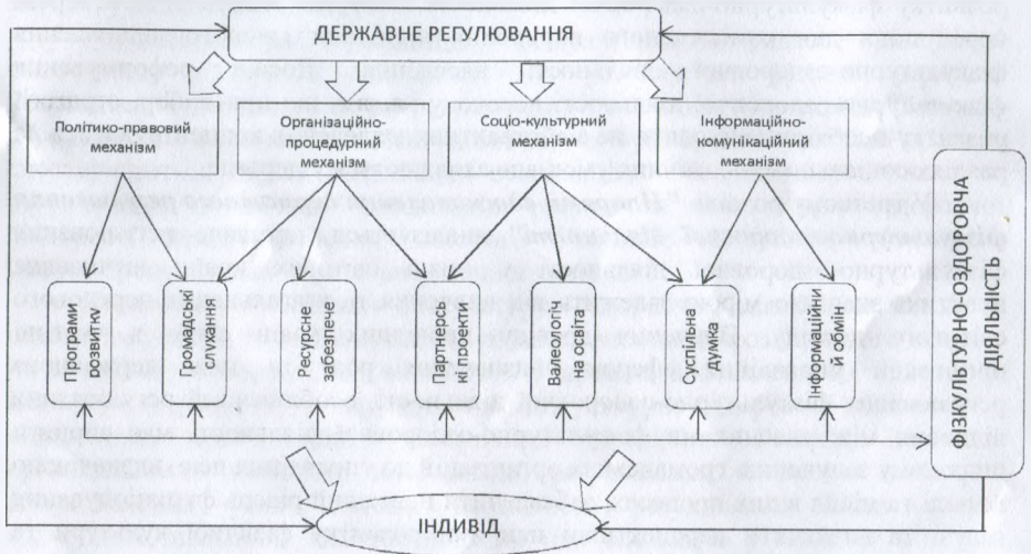
Рис. 2. Комплекс механізмів державного регулювання фізкультурно-оздоровчої діяльності

діяльності передбачається наявність сукупності структурних елементів, кожен з яких є окремим механізмом і виконує свої функції, утворюючи комплекс механізмів: політико-правовий, організаційно-процедурний, соціокультурний та інформаційно-комунікаційний механізм (рис. 2).