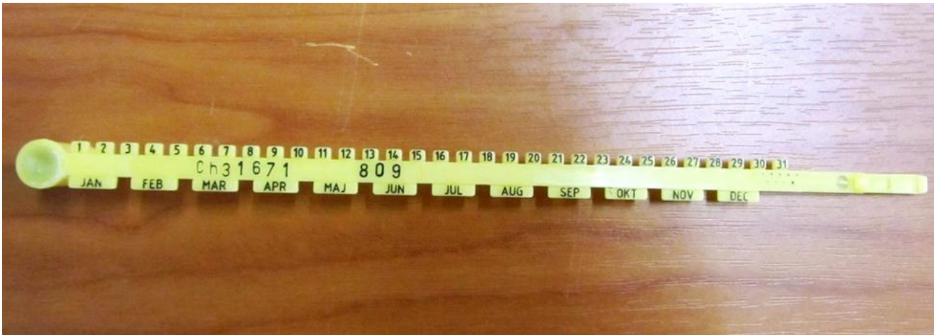
Рис. 3. Одноразова пластика бирка для маркування впольованого звіра.