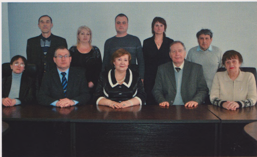
Колектив кафедри фізіології та спортивної медицини Дніпропетровського державного інституту фізичної культури і спорту