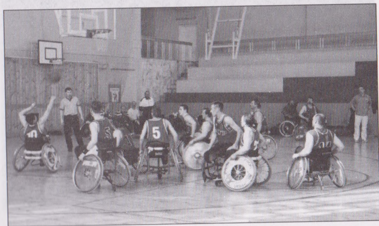
Атакуют команда Тюмени в матче с командой Москвы на чемпионате России 2001 г.