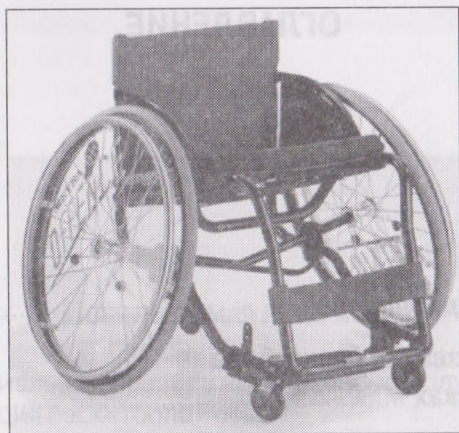
Баскетбольная коляска фирмы «Майра», модель «Офенс», одна из последних разработок