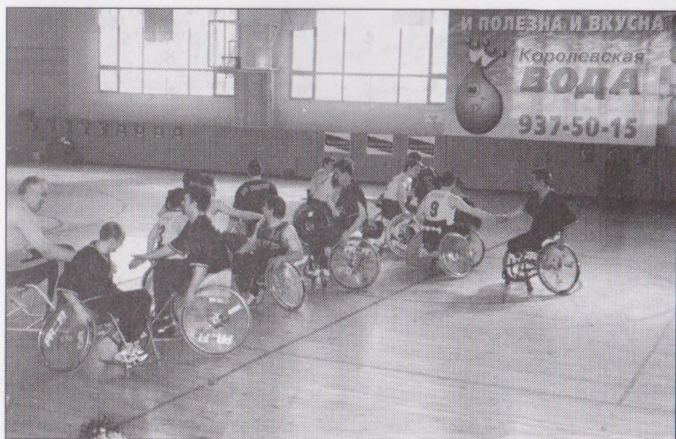
Приветствие команд Москвы — БАСКИ (г. Санкт-Петербург), XV Чемпионат России 2001 г.

Лудожестривачий редактор Е. С. Перитлов Варска