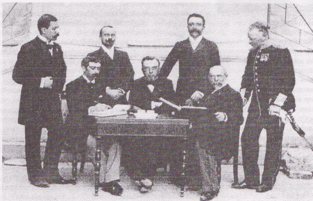
Група членів МОК (Афіни 1896 рік). Ліворуч: сидять – П'єр де Кубертен (Франція), президент МОК Деметріус Вікелас (Греція), генерал Олексій Бутовський (Росія); стоять – Вільгельм Гебхардт (Німеччина), Іржі Гут Яркоўські (Богемія), Ференц Кемень (Угорщина), генерал Віктор Балк (Швеція)

- О.Бутовський – член МОКу для Росії (рис.2);