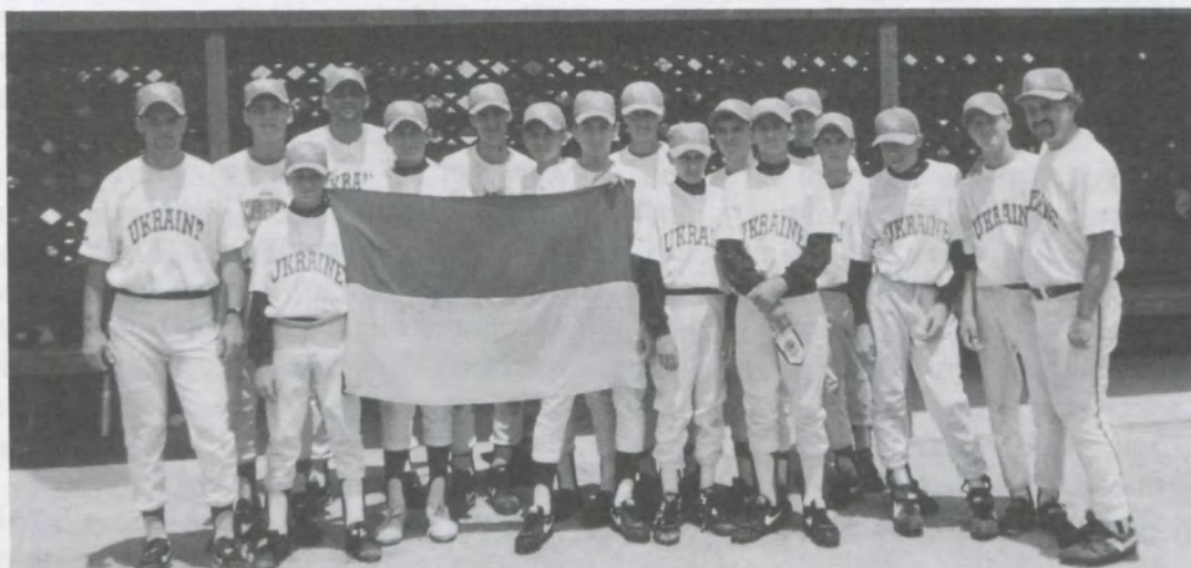
Бейсболева репрезентація України кадетів на турнірі в ЗСА.