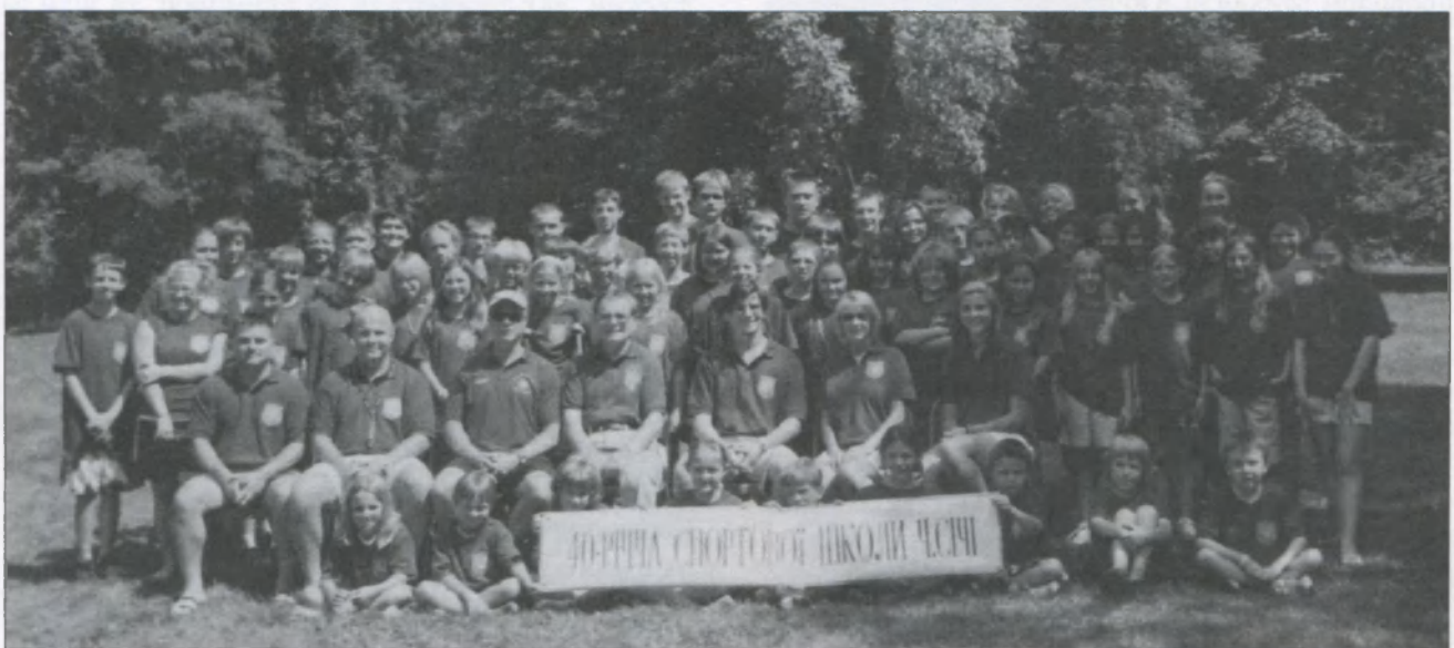
Учасники, інструктори і Провід Спортової Школи Ч.Січі на Союзівці в другому тижні, 2009 році.