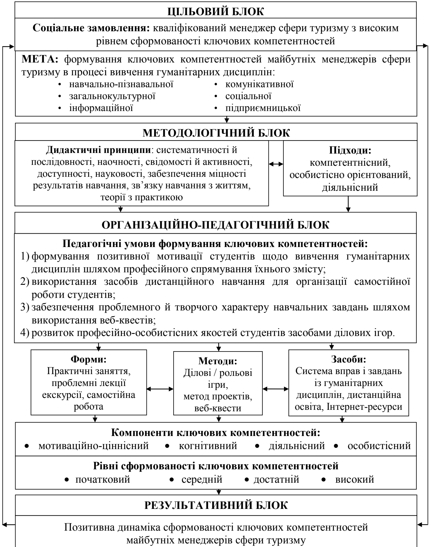
Рис. 1. Модель формування ключових компетентностей майбутніх менеджерів сфери туризму в процесі вивчення гуманітарних дисциплін