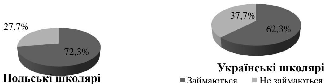
Рис. 4. Відвідування спортивних секцій польськими та українськими школярами

Кількість щоденної фізичної активності школяра напряму залежить від того чи займається він у будь-яких спортивних секціях. Наше дослідження показало, що 72,3% польських школярів і 62,3% українських регулярно займаються у спортивних секціях. Кожен четвертий школяр в Польщі (27,7%) і кожен третій в Україні (37,7%) не відвідують спортивних секцій. Отже, як видно (рис. 4), у Польщі більша кількість школярів присвячує свій вільний час заняттям у різноманітних спортивних секціях, ніж в Україні.