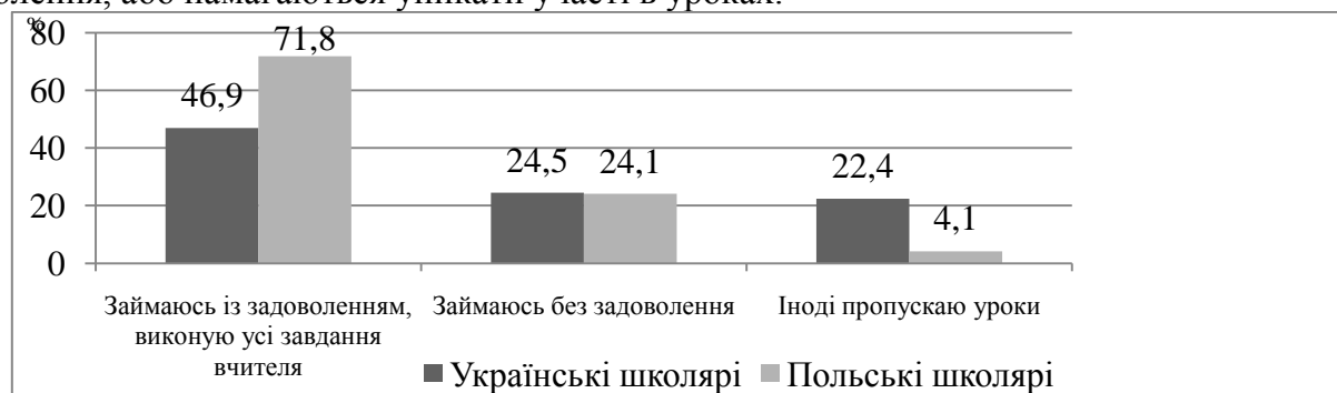
Рис.1 Суб'єктивна оцінка польських і українських школярів своєї активності на уроках фізичної культури

на уроках фізичної культури, проте лише половина (46,9%) українських школярів позитивно відносяться до уроків. Займаються без задоволення близько чвертини учнів як в Україні так і в Польщі. Проте учні шкіл України частіше уникають участі в уроках (22,4%), ніж учні польських шкіл (4,1%). Отже, наше опитування показало, що польські школярі набагато активніші на уроках і з більшим задоволенням відвідують уроки та майже не пропускають їх, тоді як українські школярі не так високо цінують уроки фізичної культури, менше активні під час уроків, більша половина з них займаються без задоволення, або намагаються уникати участі в уроках.