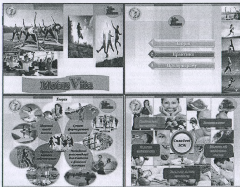
Рис. 2. Вікна мультимедіа інформаційно-методичної програми «MotusVita», роздрукування з екрана комп'ютера

Відповідно до отриманих даних експертної оцінки і результатів дослідження мотиваційно-потребової сфери школярів з вадами слуху, нами розроблена мультимедіа інформаційно-методична програма «MotusVita», яка включає теоретичну і практичну частину (рис. 2).