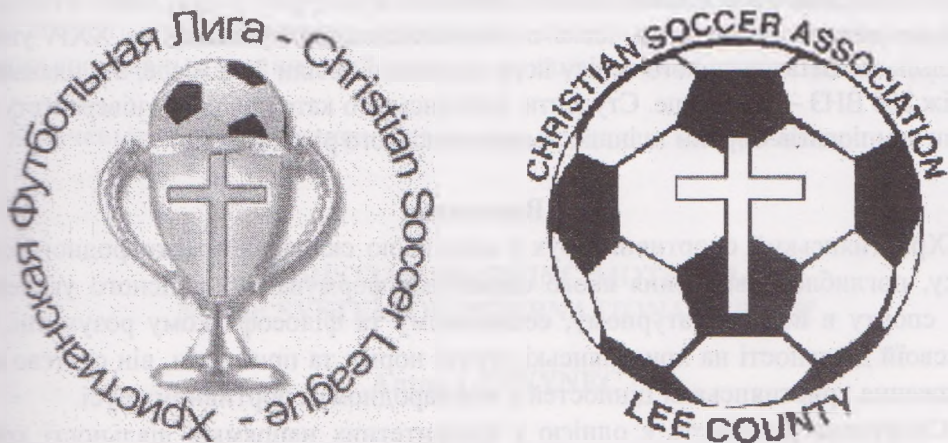
Рис. 3. Типові емблеми християнських футбольних ліг

У програмі християнських спортивних олімпіад та в навчальних закладах християн проводяться змагання з наступних видів спорту: футбол, баскетбол, гандбол, волейбол, великий волейбол, великий теніс, настільний теніс, велоспорт, плавання, легка атлетика (біг, стрибки, штовхання ін), шахи, веслування, бадмінтон, скелелазіння, дзюдо, карате, боротьба та ін. [9, 11].