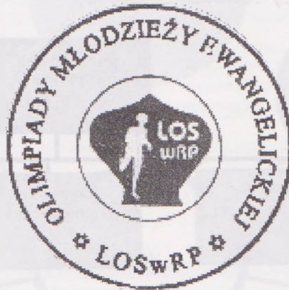
Рис. 4. Символ Євангельської молодіжної олімпіади Лютеранської спортивної організації

розвитку спорту та пошуку обдарованих і талановитих спортсменів. Для прикладу в останні роки в Польщі спостерігається тенденція, коли для спортсменів Євангельських спортивних олімпіад встановлюються обмеження щодо кількості учасників парафій, що своєю чергу призводить до зростання конкуренції. В останні роки наслідком цього є зростаюче число євангельської молоді, яка навчається в Академіях фізичної культури (Катовице, Вроцлава, Варшави). Девіз Лютеранської спортивної організації: “Старанний в науці, чіткий в спорті, ширий у вірі” [5, 11].