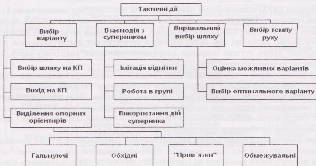
Рис. 2. Структурна схема тактики змагальної діяльності спортсменів-орієнтувальників

Вибір варіанту – основне тактичне завдання орієнтувальника під час проходження дистанції. При виборі варіанту спортсмен-орієнтувальник виділяє опорні орієнтири – об'єкти, які чітко помітні на карті і місцевості. Опорні орієнтири поділяють на гальмуючі, обмежувальні, обхідні та “прив'язки”. Гальмуючими називають легко помітні орієнтири, розташовані перпендикулярно напрямку руху та за КП, в першу чергу вони необхідні для контролю пройденої відстані. Обмежувальними називають орієнтири, які розміщені вздовж шляху руху, вони дозволяють контролювати напрямок руху. Обхідні – ті, які необхідно обходити, наприклад болота, озера. “Прив'язки” – орієнтири, з яких починається „точне” орієнтування.