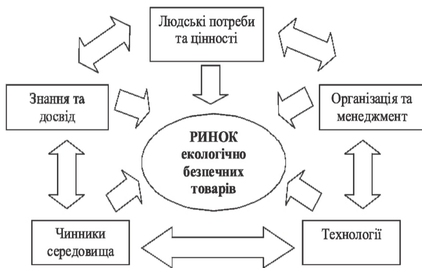
Рис. 1. Взаємопов'язані системи, еволюція яких викликала розвиток ринку екологічно безпечних товарів