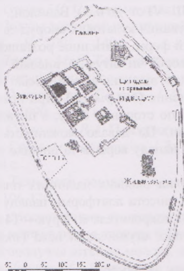
Рис. 2. Схематичний план м. Ур 4