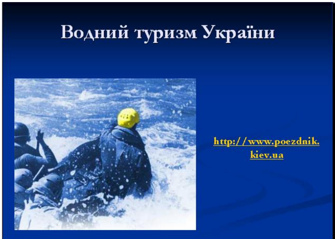
Рис. 23. Приклад оформлення слайду № 3