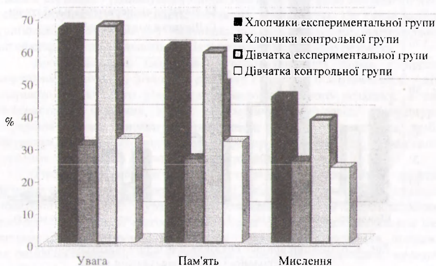
Рис. 2. Відносний приріст показників сформованості психічних функцій у дітей контрольної і експериментальної груп

На прикінці дослідження у дітей експериментальної групи на фоні позитивних показників фізичного розвитку і рівня сформованості психічних функцій, достовірно покращились показники фізичної підготовленості: сили, швидкості, спритності, гнучкості, витривалості (рис. 3).