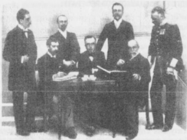
Перший склад Міжнародного Олімпійського комітету (1896 рік, Афіни) справа в нижньому ряду – П'єр де Кубертен, зліва – Олексій Бутівський

При підготовці доповіді врахувати, що за 10 хв. доповідач може прочитати або викласти матеріал 4-5-ти сторінок машинопису.