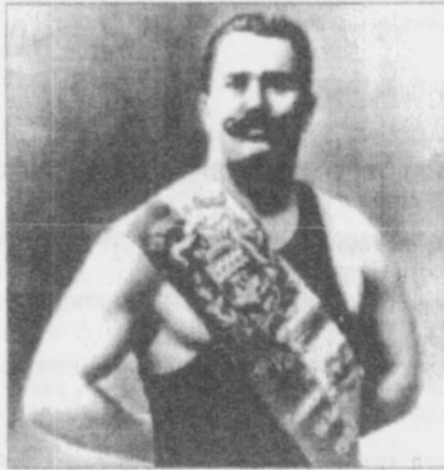
Іван Піддубний (1871-1949)

видатний український борець, багаторазовий чемпіон світу