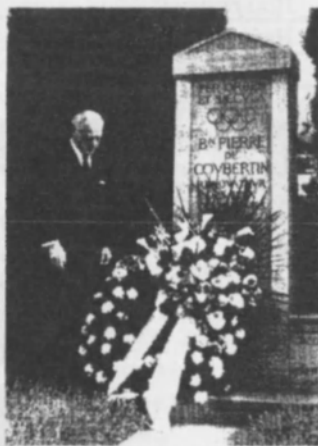
Айвері Брандедж біля могили П'єра де Кубертена у Лозанні (1965 р.)