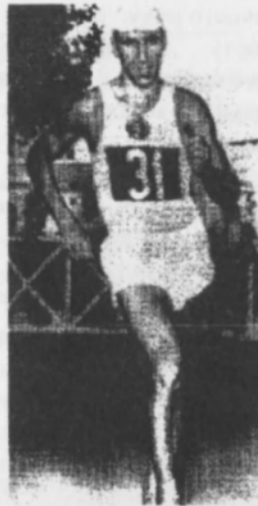
Сумчанин Володимир Голубничий (спортивна ходьба) - володар чотирьох олімпійських медалей (2 золотих, 1 срібної, 1 бронзової) на Іграх 1960, 1964, 1968, 1972 рр.)