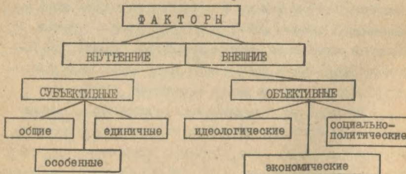
Рис. I. Классификация факторов, влияющих на эффективность воспитательного воздействия.

Анализ структуры среды воспитательной деятельности педагога-организатора позволил выявить систему непосредственных внутренних факторов, влияющих на осуществление воспитательного процесса и систему опосредованных внешних факторов, определяющих уровень осуществления воспитательного процесса. (Рис. I).