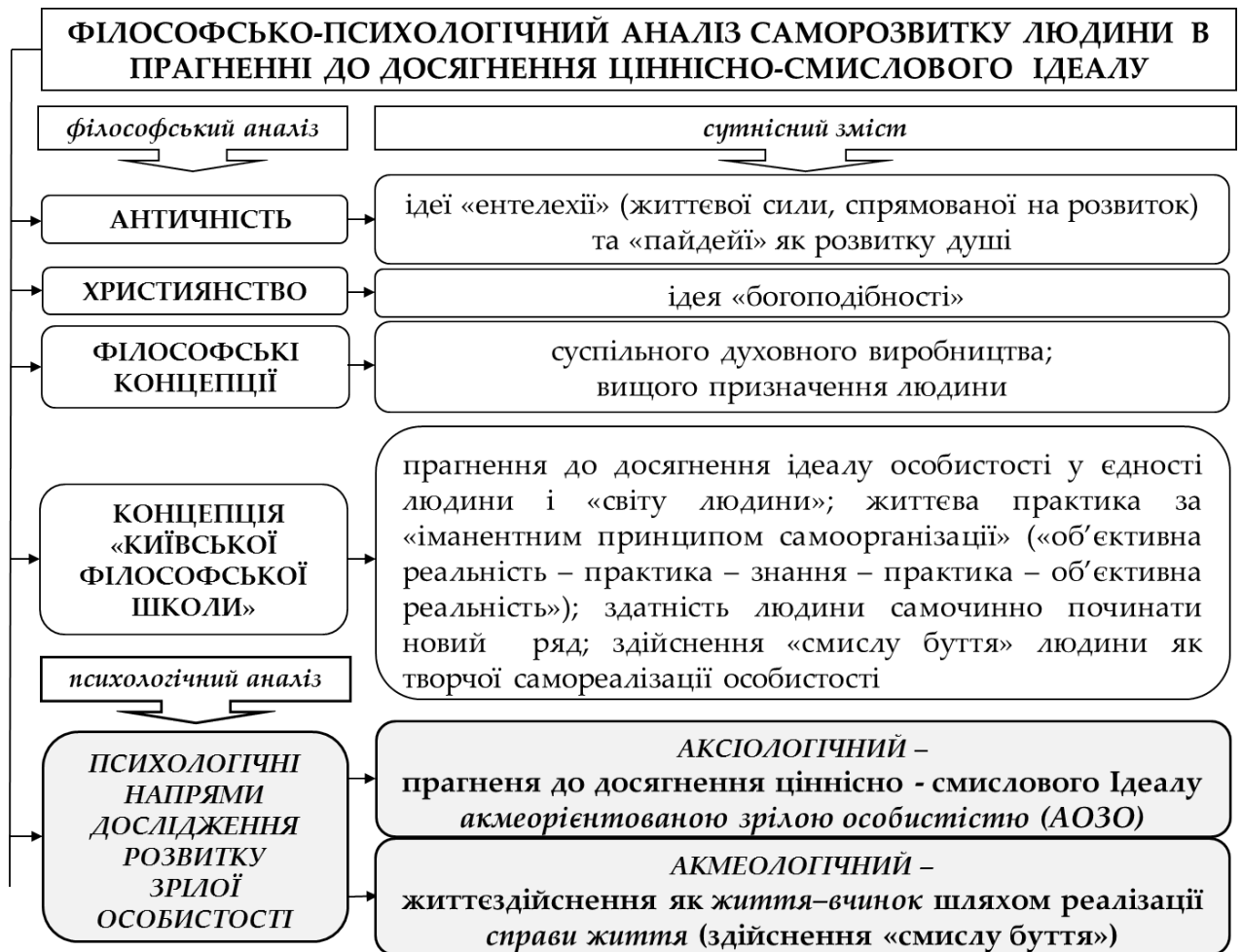
Рис. 1. Філософсько-психологічний аналіз саморозвитку людини в її прагненні до досягнення «акме»

На основі аналізу культурно-психологічних концепцій особистості, сконцентрованих на переосмисленні методологічних положень С.Л. Рубінштейна стосовно суті категорії способу життя людини, виокремлено аксі-вектор (аксіологічний вектор) її розвитку, що градуований як: «дореклексивний», «рефлексивний» та «духовний» ціннісно-смислові рівні її особистісного зростання. Дореклексивний рівень (Др) описує життєвий стан людини як соціального індивіда, що існує «усередині» життя, та завдяки життєвим викликам і досвіду різноманітних взаємодій з іншими людьми відкриває для себе необхідність підтримання відповідних продуктивних моральних настанов (протилежним є її моральна деградація). Рефлексивний рівень (Рф) пов'язаний з появою у людини рефлексії діяльності та вчинків своїх і чужих, необхідних для цілісного усвідомлення себе як суб'єкта життєздійснення у контексті життя-вчинку. Духовний (Дх) передбачає вищий рівень розвитку особистості, яка не лише приймає соціальний світ, а й займає в ньому активну позицію творення духовного продукту, що збагачує як її саму, так і наповнює суспільство відповідним соціокультурним змістом. Обґрунтовано, що саме на цьому рівні особистість найбільше переживає власне «акме», що надалі уможлиблює її «вершинний» розвиток.