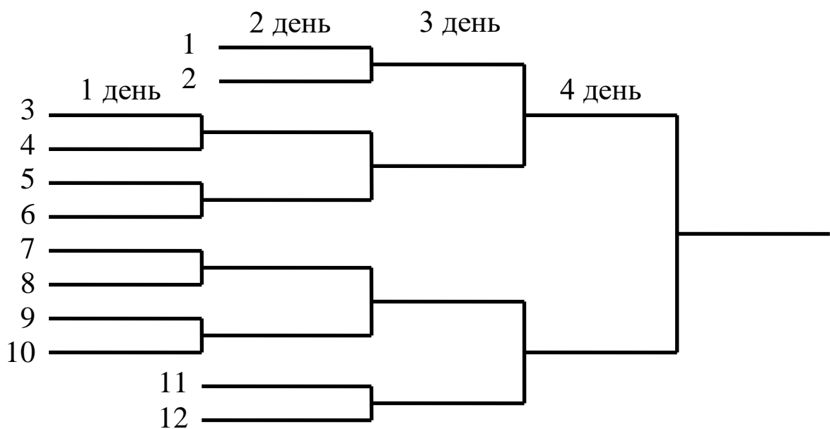
Рис. 2. Порядок зустрічей на 12 команд

Тільки вісім команд гратимуть у перший день змагань, а решта чотири розпочнуть ігри лише наступного календарного дня (рис. 2).