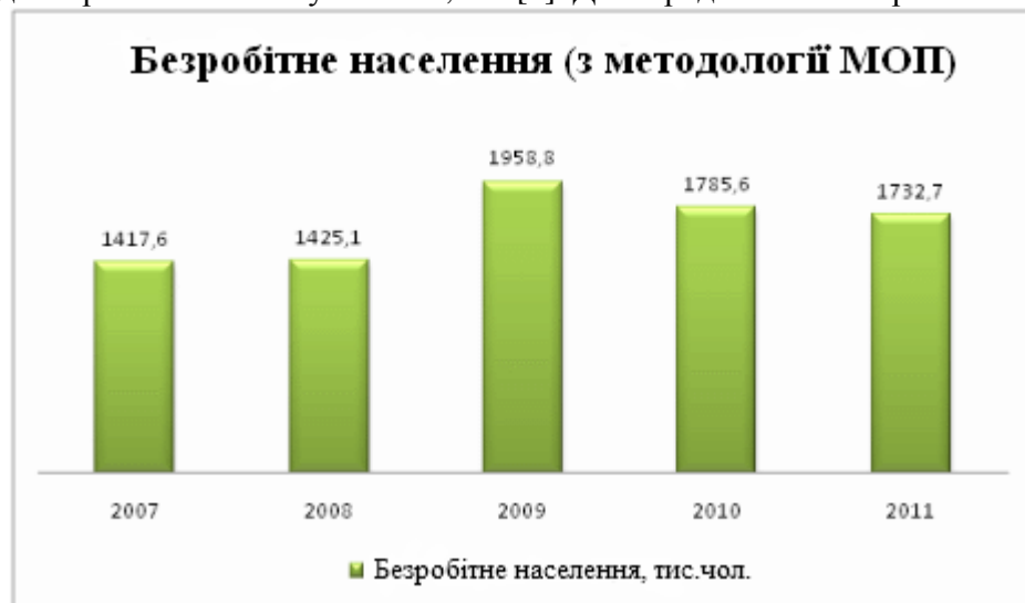
Рис. 1. Безробітне населення (з методології МОП)

В умовах ринкової економіки коли право на працю реалізується не через соціальні гарантії, а через особисту ініціативу. Проблема зайнятості молоді стає особливо гострою. Майже половина безробітних у світі – молодь у віці від 15 до 24 років. Вона становить лише 4 – ту частину від загальної кількості населення працездатного віку, ймовірність безробіття для молодих людей втричі вище, ніж для дорослих [1, с.86]. Дана проблема актуальна і для України. Слід зауважити, що загальна чисельність безробітних у нашій країні у віці від 15 до 70 років за методологією МОП зросла з 1417,6 тис. чол. в 2007 р. до 1785,6 чол. в 2010 р., тобто з 6,4 до 8,1% від економічно активного населення. У той же час потреба в робочій силі на кінець року скоротилася з 169,7 тис. чол. в 2007 р. до 63,9 тис. чол. в 2010 р. Не дивлячись на таку негативну тенденцію, рівень зайнятості серед людей у віці 25 - 49 років в 2010 р. досяг 75% від загальної чисельності населення відповідної вікової групи, проте серед молодих людей від 15 до 24 років він склав усього 34, 5% [2]. Дані представлено на рис.1.