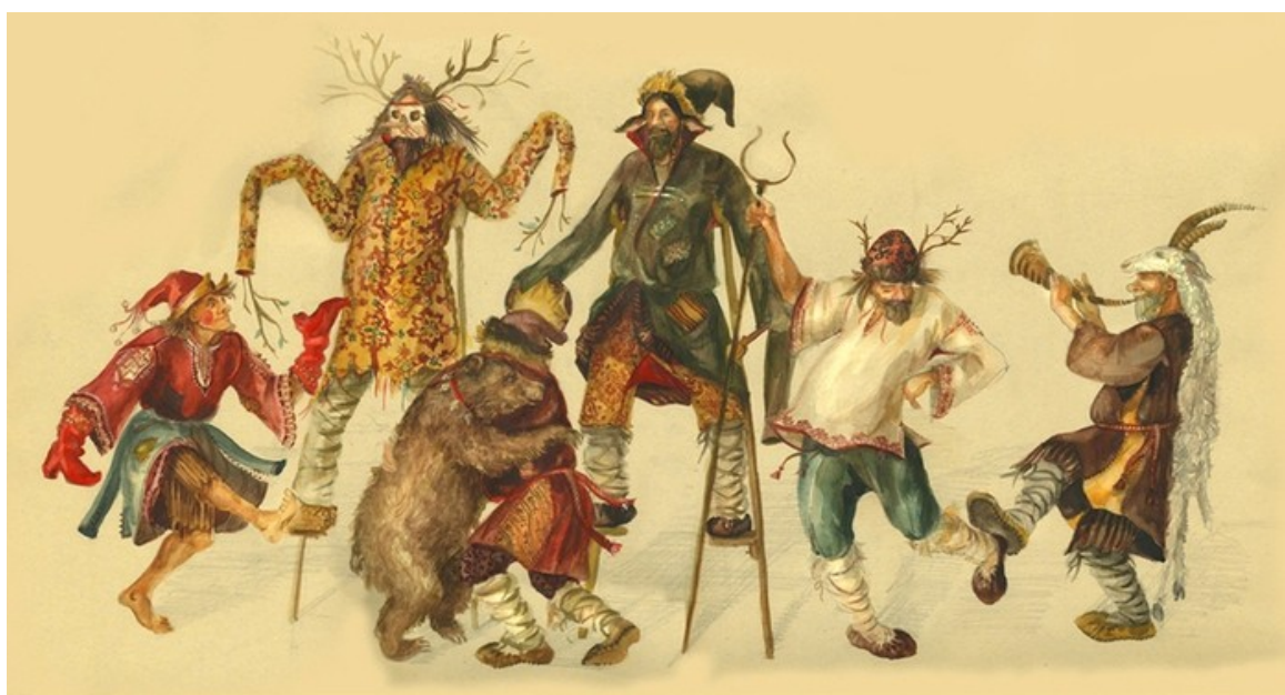
Рис. 3. Скоморохи