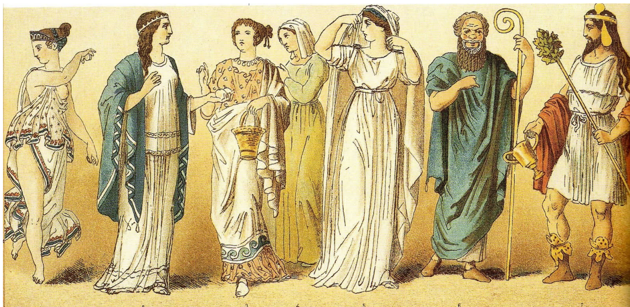
Рис. 2. Сценічне мистецтво в Стародавній Греції

Тут професія актора була дуже популярна. Кожен прославлений полководець, вважав своїм обов'язком мати при собі штат акторів, які крім