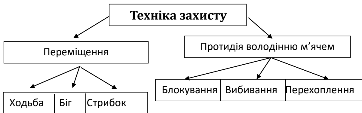
Рис. 2 Класифікація техніки захисту

Основна стійка захисника – це положення на зігнутих під кутом 160-170 градусів і розставлених на 20-40 см ногах. Спина не напружена, руки зігнуті в ліктьових суглобах під прямим кутом знаходяться в зручному положенні для швидкого руху ними в будь-якому напрямку. Вага тіла розподілена на обидві ноги, погляд спрямований на суперника, якого опікує захисник, а периферичним зором контролює розміщення інших гравців та рух м'яча на майданчику.