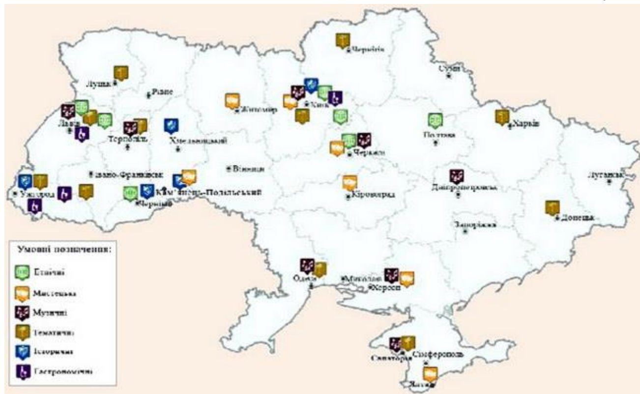
Рис. 2. Місця проведення регулярних міжнародних фестивалів в Україні

Новим для України, проте добре апробованим в європейських країнах, напрямом підвищення конкурентоспроможності регіонів має стати комплексний маркетинг регіонів та створення їхнього іміджу. Він передбачає створення державних і регіональних інформаційних систем, які б нагромаджували інформацію про регіони, їхній потенціал, потреби та конкурентні переваги, зокрема історико-культурні надбання, презентацію регіонів на міжнародних виставках, симпозіумах тощо. Державна політика щодо підтримки депресивних територій недостатня. Вона повинна носити більш системний характер та бути більш ефективною з точки зору досягнення кінцевих результатів, тобто подолання депресивності територій. Дуже важливим є законодавче врегулювання проблеми стимулювання розвитку регіонів. Для категорії малих та середніх міст забезпечуватиметься розвиток соціальної сфери, роль якої у таких населених пунктах є провідною, а також розвиток пов'язаних з нею галузей та видів діяльності. Так, поряд з лікуванням, відпочинком і туризмом розвиватимуться також фестивальна, театральна-концертна, спортивно-видовищна діяльність, будівельна індустрія, харчова, легка, сувенірна промисловість, виробництво будівельних матеріалів, транспорт, роздрібна торгівля, громадське харчування та інші галузі. Увага приділятиметься підготовці кадрів (для охорони здоров'я, екскурсійної справи, перекладачів, фестивальної діяльності, культури тощо).