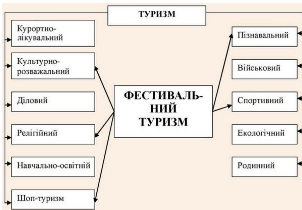
Рис. 1. Місце фестивального туризму в структурі туристичної діяльності Передумови виникнення фестивалів: