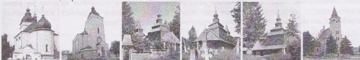
Рис. 2. Сакральні об'єкти Рогатинщини [9].

Середній рівень доходів на душу населення в районі становив у 2008 р. 1473 грн. в місяць та різнився у різних сферах економіки. Найбільші доходи спостерігалися у секторі будівництва й транспорту, газопостачання, а також харчовій промисловості. Середній рівень заробітної платні в державним підприємствах становив у 2001 р. – 1287,6 грн., натомість як на приватних та акціонерних він сягав – 2075,5 грн.