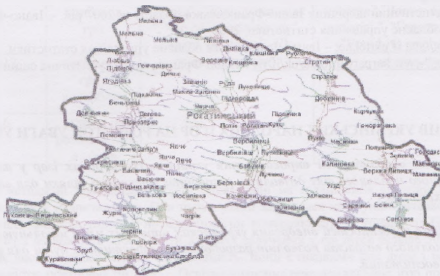
Рис. 3. Рогатинський район Івано-Франківської області [9].

В релігійному відношенні більшість населення Рогатинщини є християнами, причому більш-менш пропорційним є поділ на православну та греко-католицьку громади. Проте в останні роки на території району намітилися тенденції до активізації діяльності організацій новітнього трактування канонів християнства, що залучають в свої ряди, в основному, молодих людей. В цьому аспекті найбільш пропагуючу діяльність проводять Свідки Єгови України, релігійні осередки яких за роки незалежності України, виникли практично в усіх великих селах Рогатинщини.