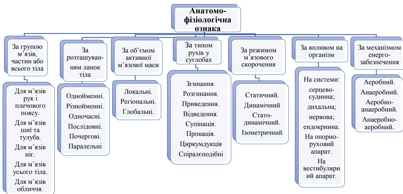
Рис. 1. Класифікація вправ за анатомо-фізіологічною ознакою

перша група - за групою м'язів, частин тіла або всього тіла. На рис. 1 показано, що вправи можна класифікувати в залежності від того, яку роботу виконують ті або інші м'язові групи, частини тіла або усе тіло в цілому. Згідно цього вправи розподіляються на: вправи для м'язів рук і плечового поясу, для м'язів шиї та тулуба, для м'язів ніг, для м'язів усього тіла, для м'язів обличчя.