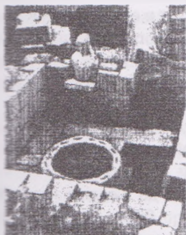
Рис. 1. Ольвійський гімнасій. Приміщення з криницею та встановленим у ніші зотрудням Аполлона.

честь ольвіополіти викарбували камінний декрет, у якому, серед інших діянь, згадується про піклування будівництвом гімнасію [2, № 40].