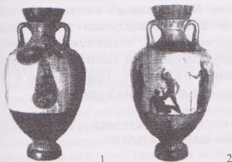
Рис. 4. Панафінейська амфора, знайдена в кургані біля станиці Єлизаветинської на Кубані. Кінець V ст. до н.е. 1 – богиня Афіна; 2 – група кулачних бійців і суддя змагань.

Знахідка у 1899 році під час розкопок оборонних стін Херсонесу в гробниці бронзової посудини із написом на горлі "приз зі (свята) Анакій" [34, с.7-8; 26, 31-32; 35, с.10-11] дозволяє засвідчити перемогу одного із херсонеських атлетів на афінському святі Анакій на честь братів Діоскурів - Кастора та Полідевка у IV ст. до н.е. Зазвичай, у програму цього святкування входили кінні змагання. А переможець нагороджувався посудиною з відповідним написом, наповненою оливковою олією зі священного дерева [35, с.10-11].