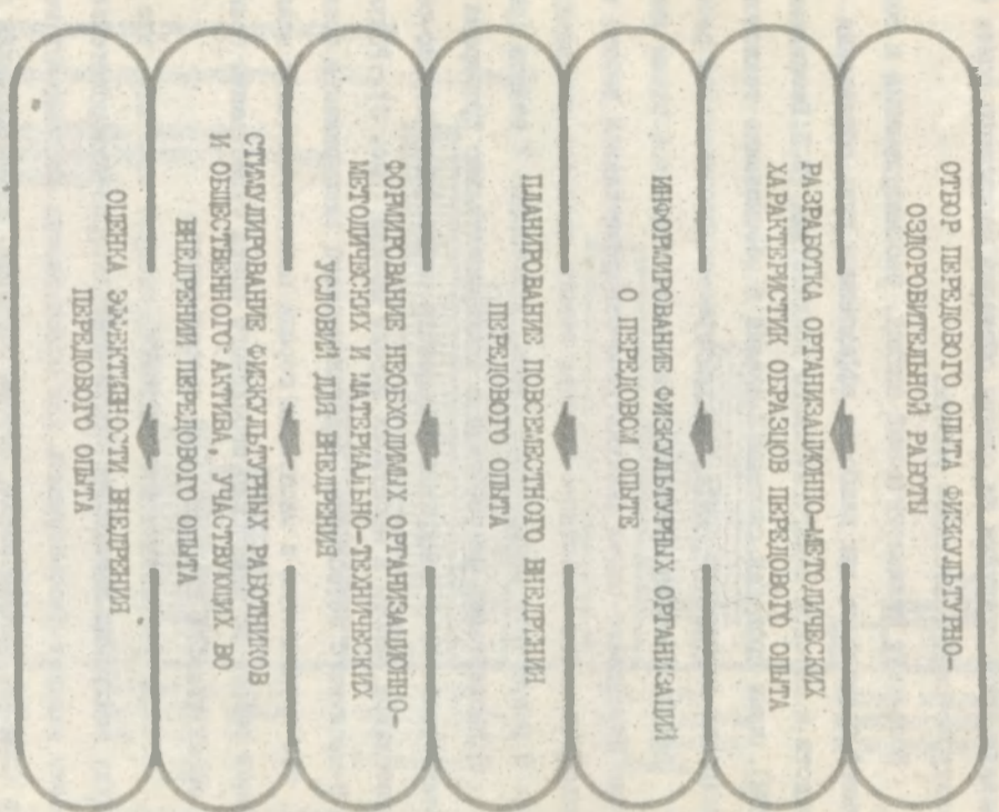
Рис. 2 Организационно-технологическая схема внедрения передового опыта физкультурно-оздоровительной работы (ПО:ОР)