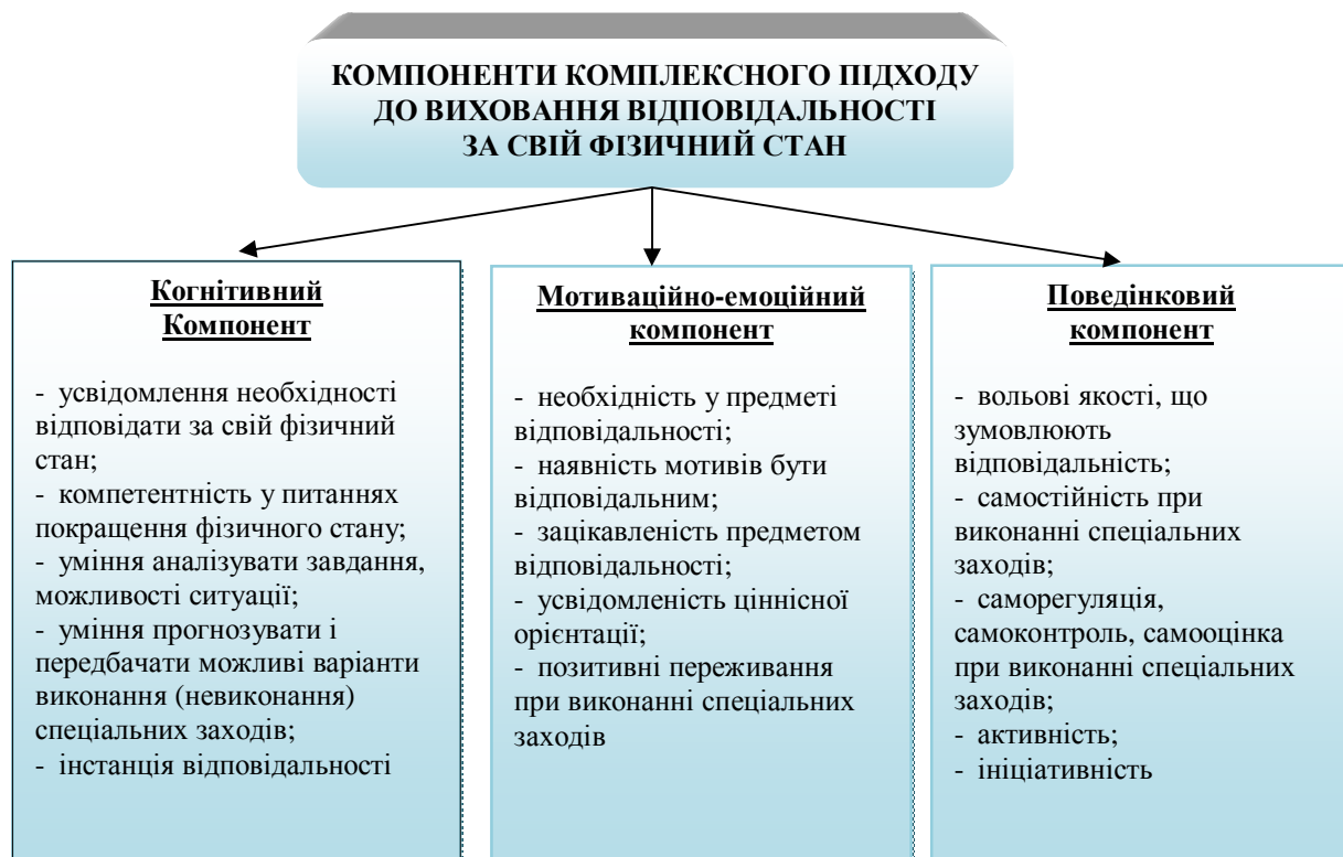
Рис. 3. Складові відповідальності гімнасток за свій фізичний стан

Програма передбачає виховний вплив з боку тренера, спрямованих на когнітивну, мотиваційно-емоційну та поведінкову сфери відповідальності гімнасток. Виховання високого рівня відповідальності за свій фізичний стан відбувається за рахунок підвищення рівня складових відповідальності. У програмі подані рекомендації тренерам до кожної з 15 складових відповідальності.