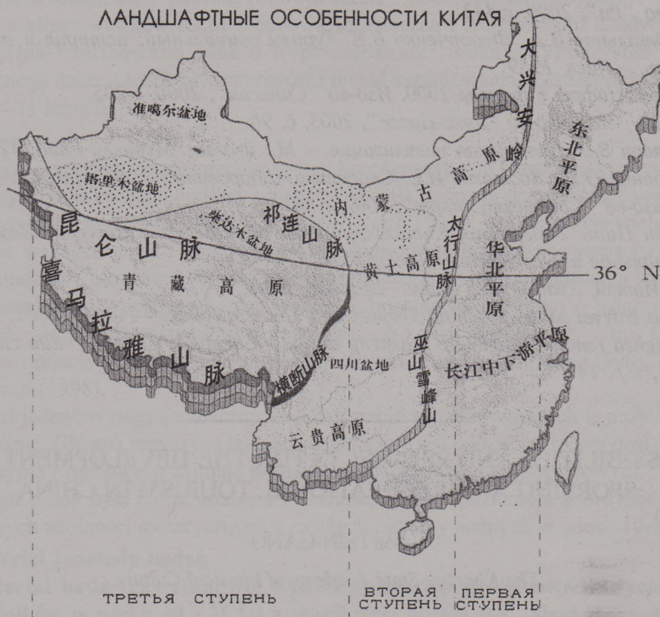
Малюнок 2. Ландшафтні особливості Китаю

– 41,9%; велика зайнятість по навчанню – 37,5%; недолік матеріальних засобів – 36,3%; відсутність знайомих досвідчених туристів – 27,4%; відсутність необхідного спорядження – 22%; слабе здоров'я – 21,4%; малий туристський досвід – 19,6%. Утрудняються що-небудь сказати – 5,4%.