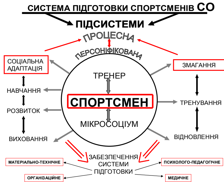
Рис. 1. Схема системи підготовки спортсменів Спеціальних Олімпіад

Система підготовки складається з двох підсистем: персоніфікованої та процесної. В свою чергу, персоніфікована підсистема представлена тріадою (грецьке τριάς ) – єдність, що утворено трьома окремими членами, частинами) «тренер-СПОРТСМЕН-мікросоціум» [195].