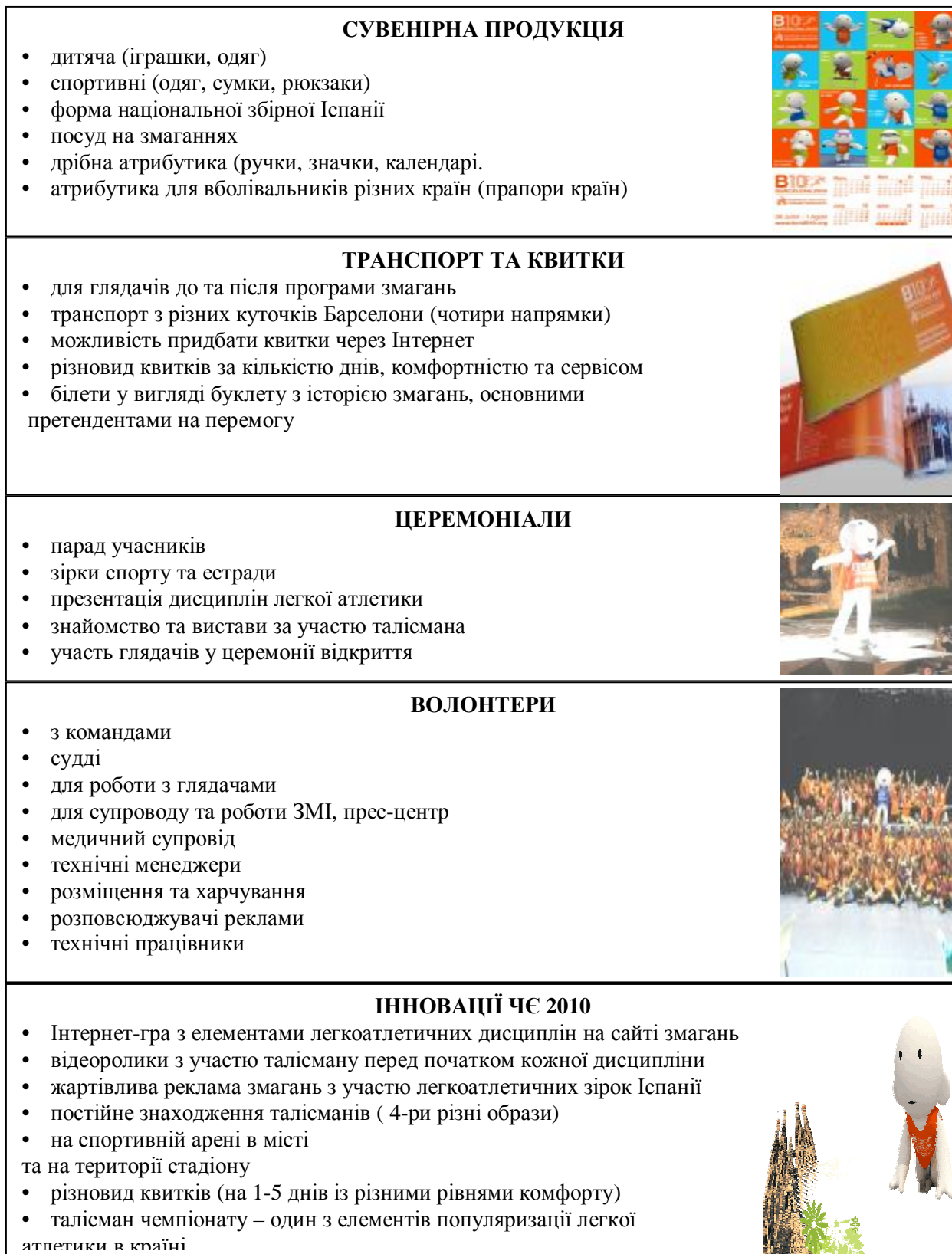
Рис. 2 Елементи комерційного підходу (комерціалізації) чемпіонату Європи 2010 р.

Чемпіонат Європи 2010р. відзначився одинадцятьма категоріями волонтерів, яких розділяли та які проходили спеціальний відбір не тільки за бажанням, а й за їх навичками та уміннями. Волонтери забезпечували організаційні моменти змагань у адміністративному, суддівському, медичному, інформаційному, транспортному напрямках, а також як перекладачі.