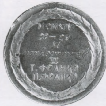
Нагорода (медаль) Тараса та Петра Франків за 2-ге місце в змаганнях із ситківки (тенісу) у грі двійками (в парі)

Петро Франко безпосередньо причетний до формулювання українського скаутського руху і