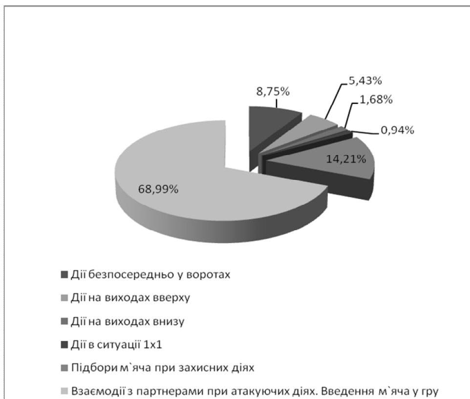
Рис. 2. Співвідношення кількісних показників техніко-тактичних дій воротаря в різних типових ситуаціях в умовах змагань (%)